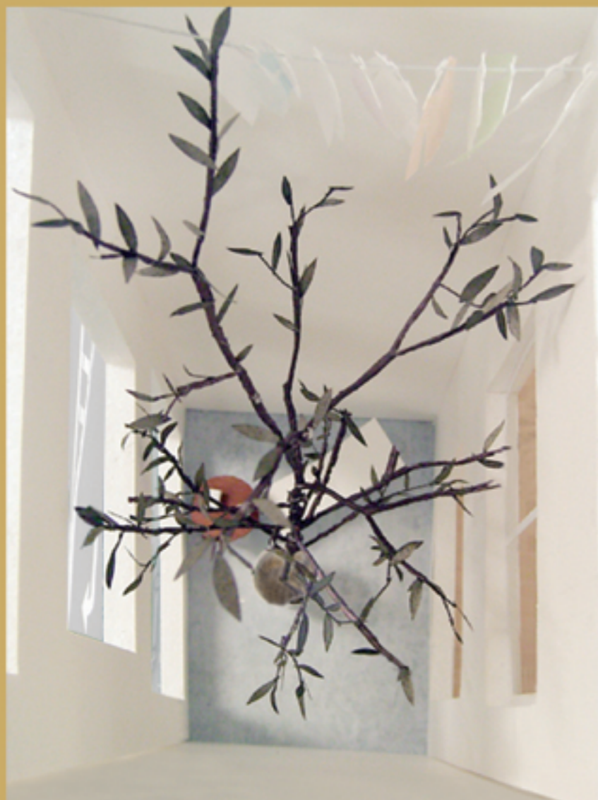
長谷川豪「練馬の Apartメント」2007-