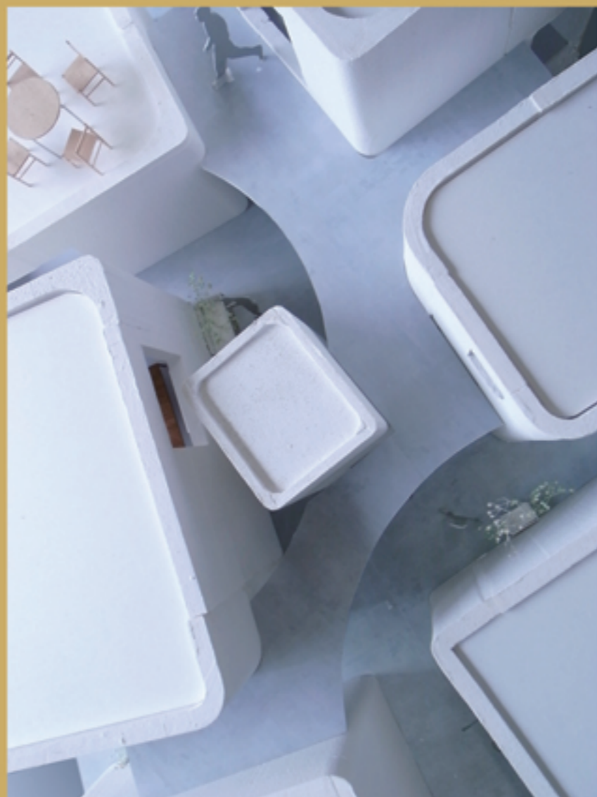
若松均「碑文谷の集合住宅」2008-